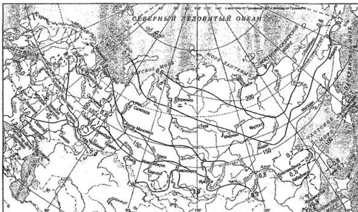
Рисунок 1 - Климатические коэффициенты для определения величины нагрузки на иловые площадки (сплошные и пунктирные линии) и продолжительности периода намораживания на иловых площадках, дни (точечные линии)

9.2.14.39 Площадь иловых площадок следует проверять на намораживание. Продолжительность периода намораживания следует принимать равной числу дней со среднесуточной температурой воздуха ниже минус 10 °С. Количество намороженного осадка следует принимать в количестве 75 % поданного на иловые площадки за период намораживания.