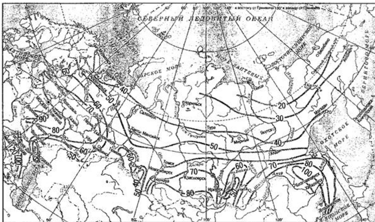
Рисунок Б.1 - Значения величин интенсивности дождя q_{20}